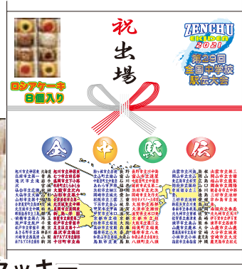
⑨ 大会記念ロシアケーキ