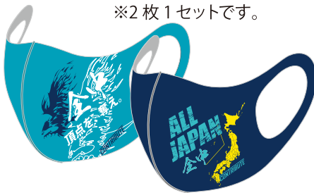
④ 全中マスクセット ※2枚1セットです。