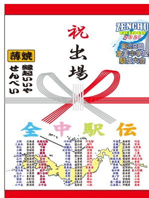
⑧ 大会記念薄焼きせんべい