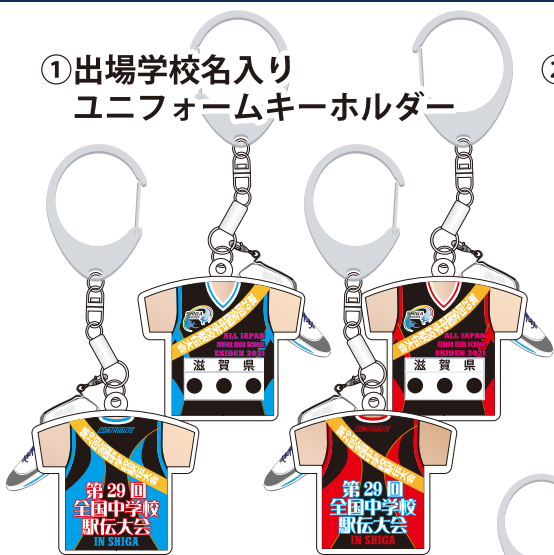
① 出場学校名入り ユニフォームキーホルダー