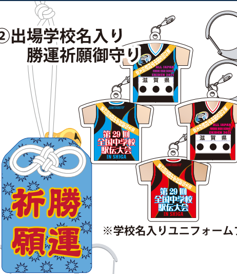
② 出場学校名入り 勝運祈願御守り